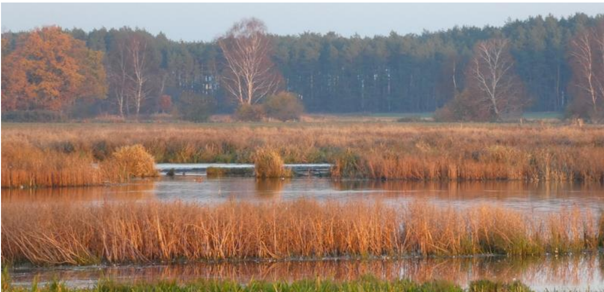
Abb. 8: Vernässungsfläche im November 2022

In den Folgejahren erfolgte die den neuen Wasserstandverhältnissen angepasste Pflegenutzung sowie die Entwicklungspflege der Gehölzpflanzungen. 2014 und 2018 wurde in den stärker vernässten Bereichen eine Mahd mit Beräumung durchgeführt, um beginnende Gehölzsukzession zurückdrängen. 2016 erfolgte erstmals eine angepasste Grabenunterhaltung in dem neuen Graben, der den Abfluss evtl. überschüssigen Wassers in die Nieplitz regelt.