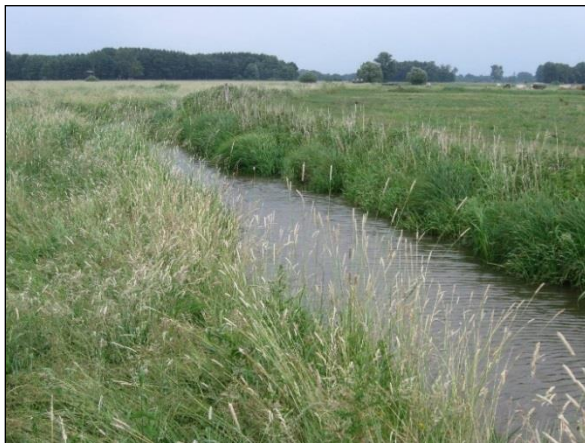
Abb. 4: Die Auslenkung am Bockwurstgraben – von hier läuft das Wasser in die Fläche

Alle Bau- und Pflanzarbeiten wurden zwischen September 2010 und April 2011 durchgeführt. Einige Bilder zu den ersten Eindrücken nach der Durchführung der Maßnahmen: