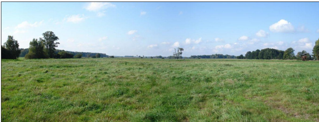
Abb. 2: Panorama der Grenzelsiesen vor Umsetzung der Pool-Maßnahmen: Großes Lebensraumpotenzial, aber wenig Lebensraumqualität und -vielfalt auf dem großflächigen Intensivgrünland

Die Grenzelsiesen sind ein bedeutender, aber vor der Realisierung der Pool-Maßnahmen stark degradierter Niedermoorstandort. Durch die Maßnahmen des Flächenpools wird dieser wieder vernässt und so der Abbauprozess des Moores gestoppt und neues Torfwachstum initiiert. Dies wird v.a. durch den teilweisen Verschluss eines heutigen Hauptentwässerungsgrabens erreicht, wodurch das Wasser in die Fläche ausgelenkt wird. Es soll sich dort ein abgestufte Folge von dauerhaft und temporär vernässten Standorten ausbilden.