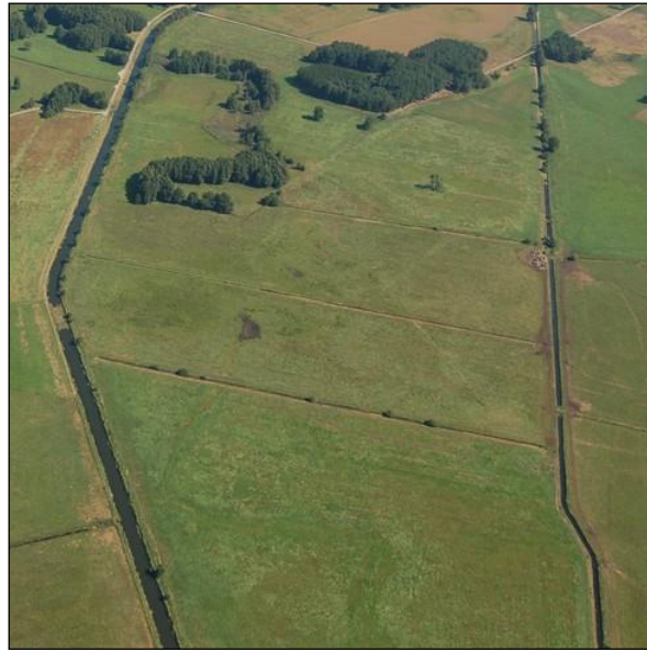
Abb. 1: Luftbild-Übersicht über die Poolfläche zwischen Nieplitz und Entwässerungsgraben

Die Grenzelsiesen sind ein bedeutender, aber vor der Realisierung der Pool-Maßnahmen stark degradierter Niedermoorstandort. Durch die Maßnahmen des Flächenpools wird dieser wieder vernässt und so der Abbauprozess des Moores gestoppt und neues Torfwachstum initiiert. Dies wird v.a. durch den teilweisen Verschluss eines heutigen Hauptentwässerungsgrabens erreicht, wodurch das Wasser in die Fläche ausgelenkt wird. Es soll sich dort ein abgestufte Folge von dauerhaft und temporär vernässten Standorten ausbilden.