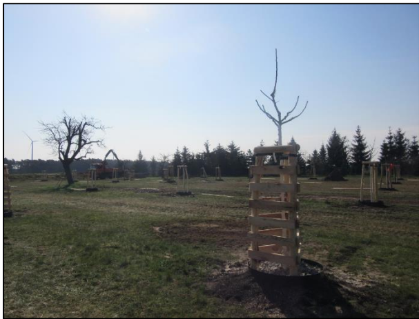
Abb. 1: Beendigung der Arbeiten auf der Streuobstwiese (2021)

Um ein gutes Anwachsen des Bestandes abzusichern, wurde eine insgesamt dreijährige Entwicklungspflege vereinbart.