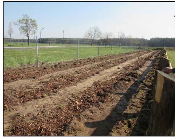
Abb. 2: Blick auf die Heckenpflanzung in südöstlicher Richtung (2021)

Weiterführende Informationen können Sie bei Bedarf unter unten angegebener Adresse erhalten.