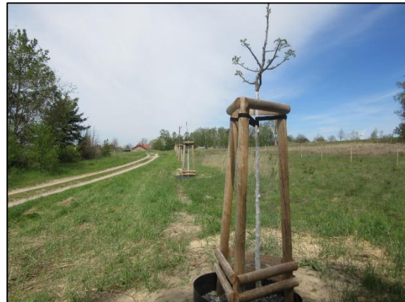
Abb. 2: Blick auf die Obstbaumreihe (Mai 2021)