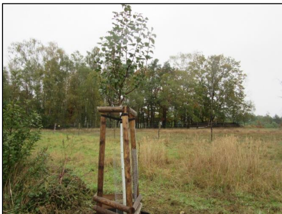
Abb. 3: Pflanzung im ersten Entwicklungsjahr (Oktober 2022, Foto: Friederike Kunz)

Weiterführende Informationen können Sie bei Bedarf unter unten angegebener Adresse erhalten.