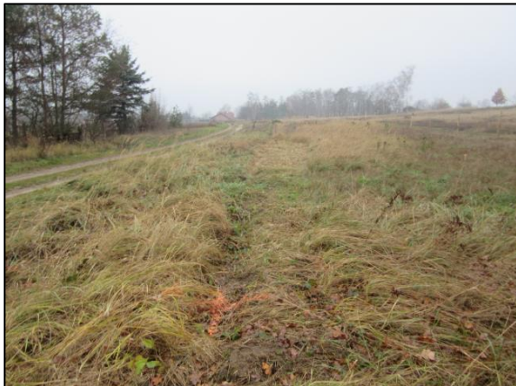
Abb. 1: Fläche vor Beginn der Pflanzung (Dezember 2020)

Um ein gutes Anwachsen des Bestandes abzusichern, wurde eine insgesamt dreijährige Entwicklungspflege vereinbart.