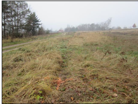
Abb. 1: Fläche vor Beginn der Pflanzung (Dezember 2020)

Um ein gutes Anwachsen des Bestandes abzusichern, wurde eine insgesamt dreijährige Entwicklungspflege vereinbart.