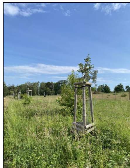
Abb. 2: Blick auf die Obstbaumreihe (Mai 2024)

Weiterführende Informationen können Sie bei Bedarf unter unten angegebener Adresse erhalten.