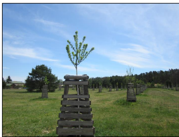
Abb. 2: Blick auf die Heckenpflanzung in südöstlicher Richtung (2021)

Weiterführende Informationen können Sie bei Bedarf unter unten angegebener Adresse erhalten.