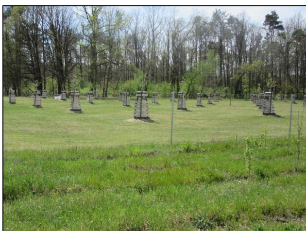
Abb. 1: Blick auf die Streuobstwiese in südwestlicher Richtung (2021)

Um ein gutes Anwachsen des Bestandes abzusichern, wurde eine insgesamt fünfjährige Pflege vereinbart.