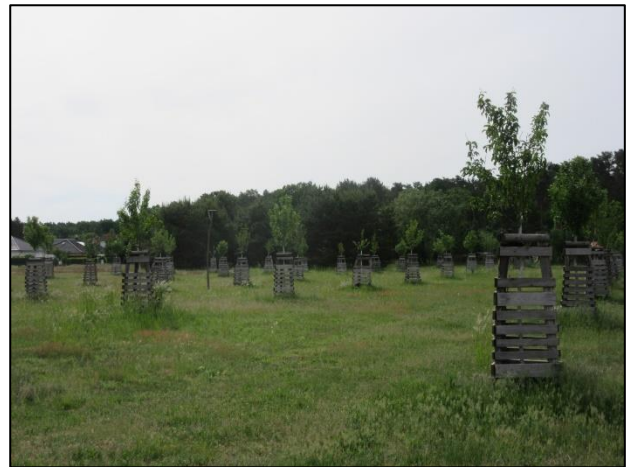
Abb. 2: Blick auf die Heckenpflanzung in südöstlicher Richtung (2022)