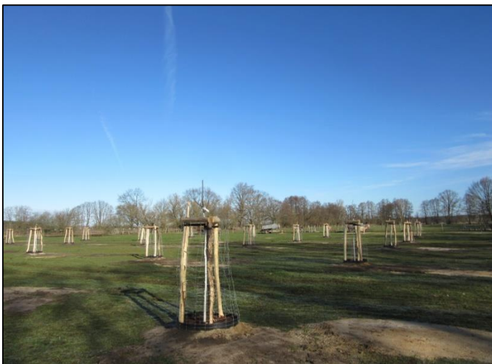
Abb. 4: Blick auf die Obstbaumreihen in Wollin (2023)

Weiterführende Informationen können Sie bei Bedarf unter unten angegebener Adresse erhalten.