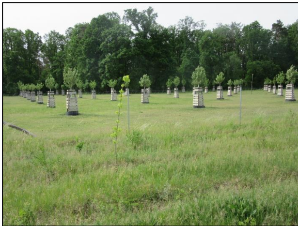
Abb. 1: Blick auf die Streuobstwiese in südwestlicher Richtung (2022)

Um ein gutes Anwachsen des Bestandes abzusichern, wurde eine insgesamt fünfjährige Pflege für beide Maßnahmenflächen vereinbart.