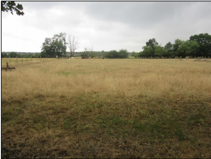
Abb. 3: Blick auf die Maßnahmenfläche vor Umsetzung in Wollin (2022)