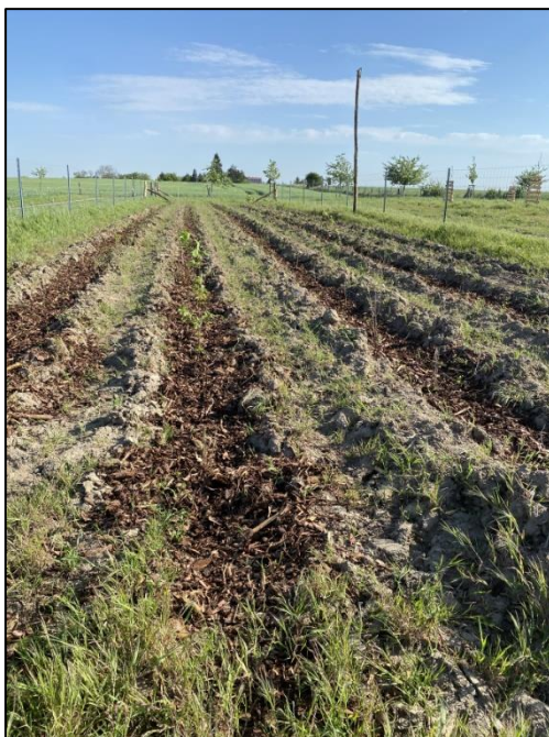
Abb. 1: Heckenpflanzung Plötzin (2024)