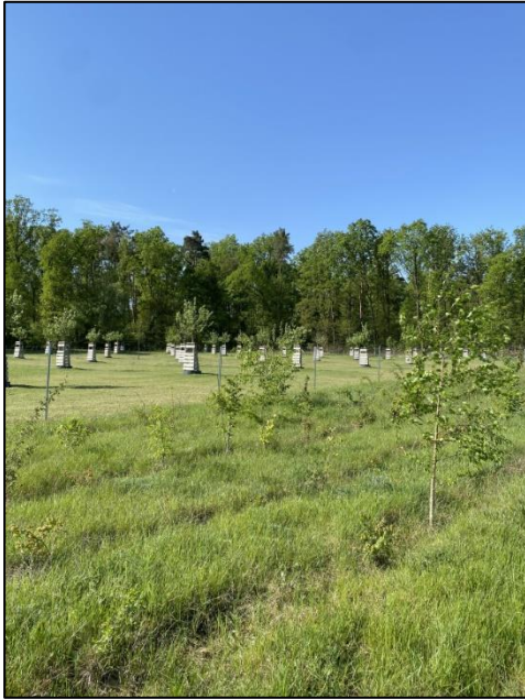
Abb. 3: Maßnahmenfläche Nahmitz (2024)