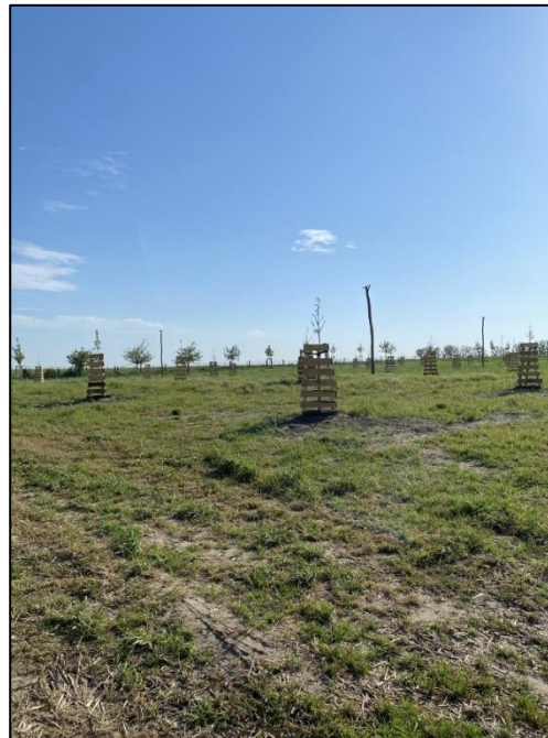
Abb. 2: Obsthochstämme der Streuobstwiese Plötzin direkt nach Pflanzung (2024)