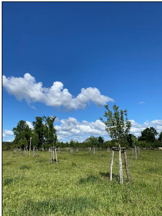
Abb. 7: Maßnahmenfläche Wollin (2025)

Weiterführende Informationen können Sie bei Bedarf unter unten angegebener Adresse erhalten.