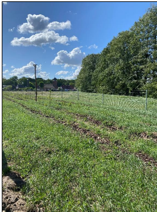
Abb. 6: Maßnahmenfläche Gräben (2025)