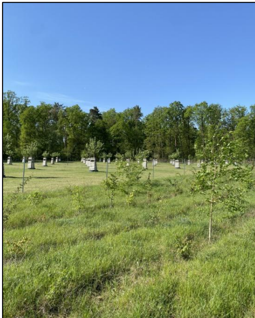
Abb. 3: Maßnahmenfläche Nahmitz (2024)