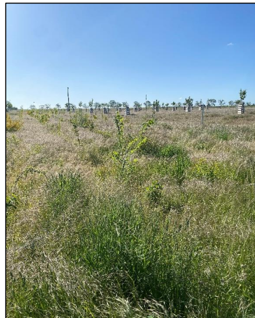
Abb. 4: Maßnahmenfläche Plötzin I (2025, Foto: Friederike Kunz)