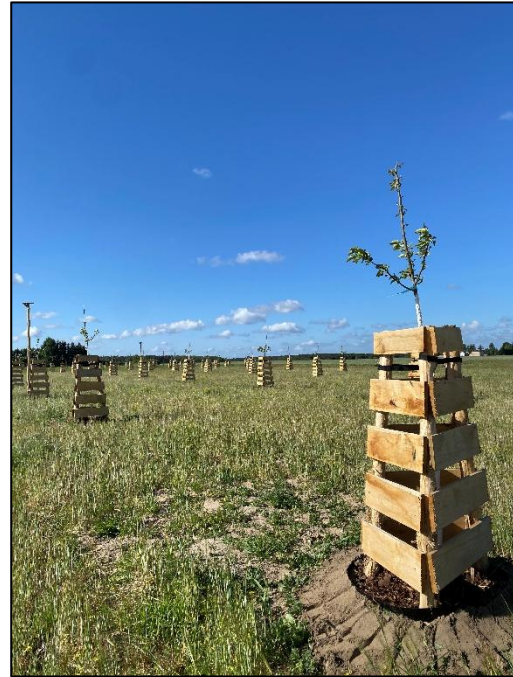
Abb. 2: Obsthochstämme der Streuobstwiese Plötzin II direkt nach Pflanzung (2025)