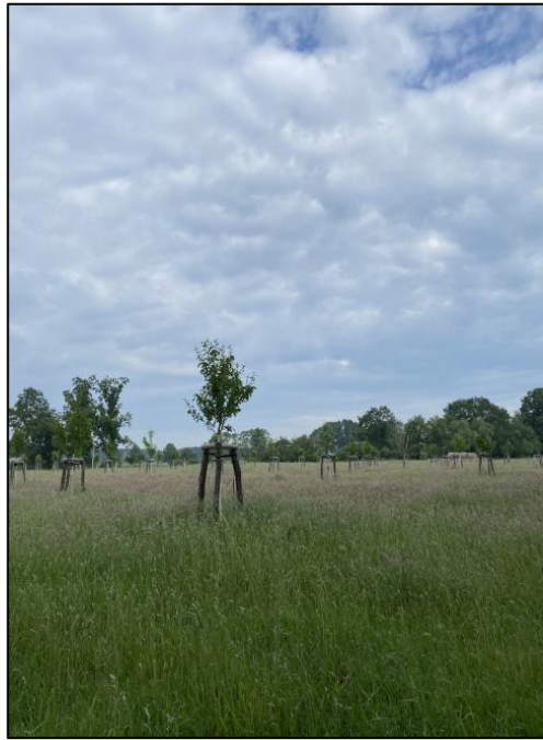
Abb. 5: Maßnahmenfläche Wollin (2024)