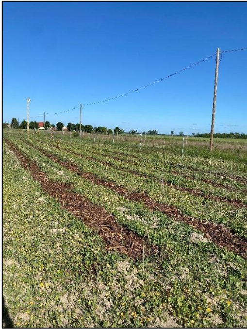
Abb. 1: Heckenpflanzung Plötzin II (2025)