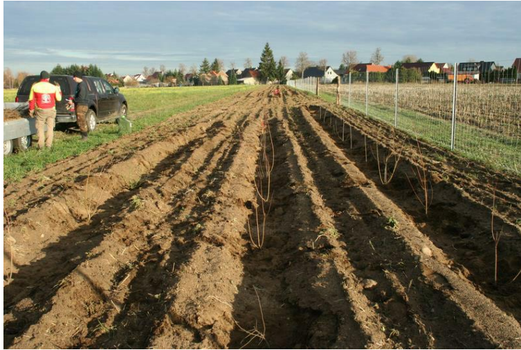
Abb. 4: Arbeiten am zweiten BA im Dezember 2018, (Foto: Dieter Wankmüller)