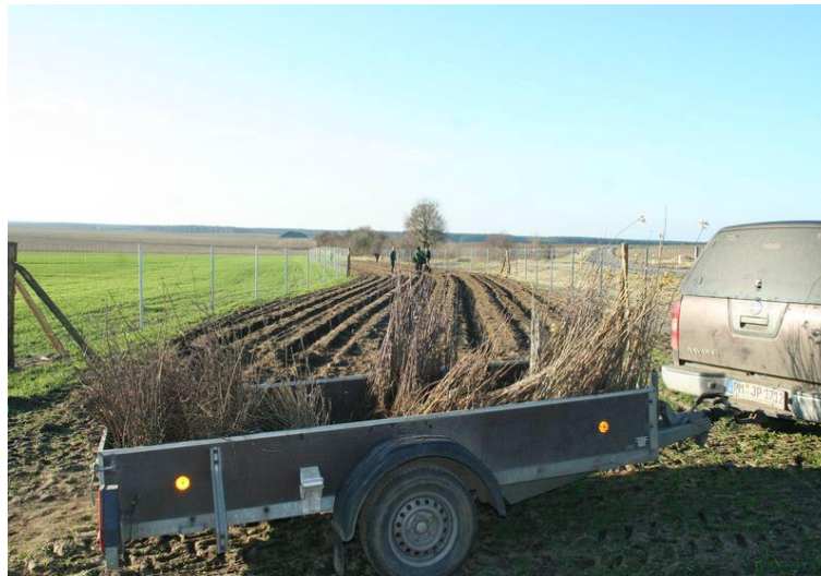
Abb. 2: Pflanzung des Ersten BA im Dezember 2017, (Foto: Dieter Wankmüller)