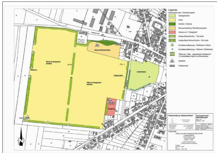
Abb. 1: Skizze des Projektes „Naturinsel Reetz“ aus dem Jahr 2010, © Projektbüro Wildwege i.A. des Vereins „Oelala“