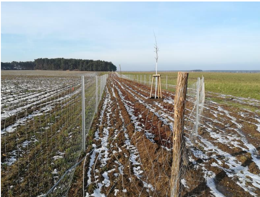
Abb. 5: Eine Hecke des zweiten BA im Februar 2019, (Foto: Martin Szaramowicz)

Weiterführende Informationen können Sie bei Bedarf unter unten angegebener Adresse erhalten.