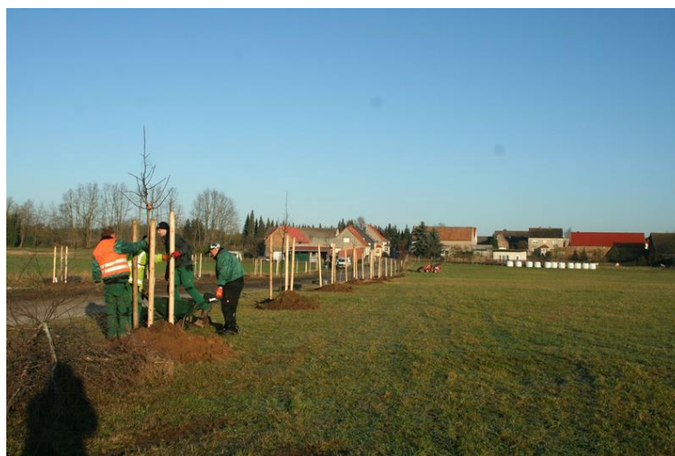
Abb. 3: Baumpflanzungen des Ersten BA im Dezember 2017, (Foto: Dieter Wankmüller)