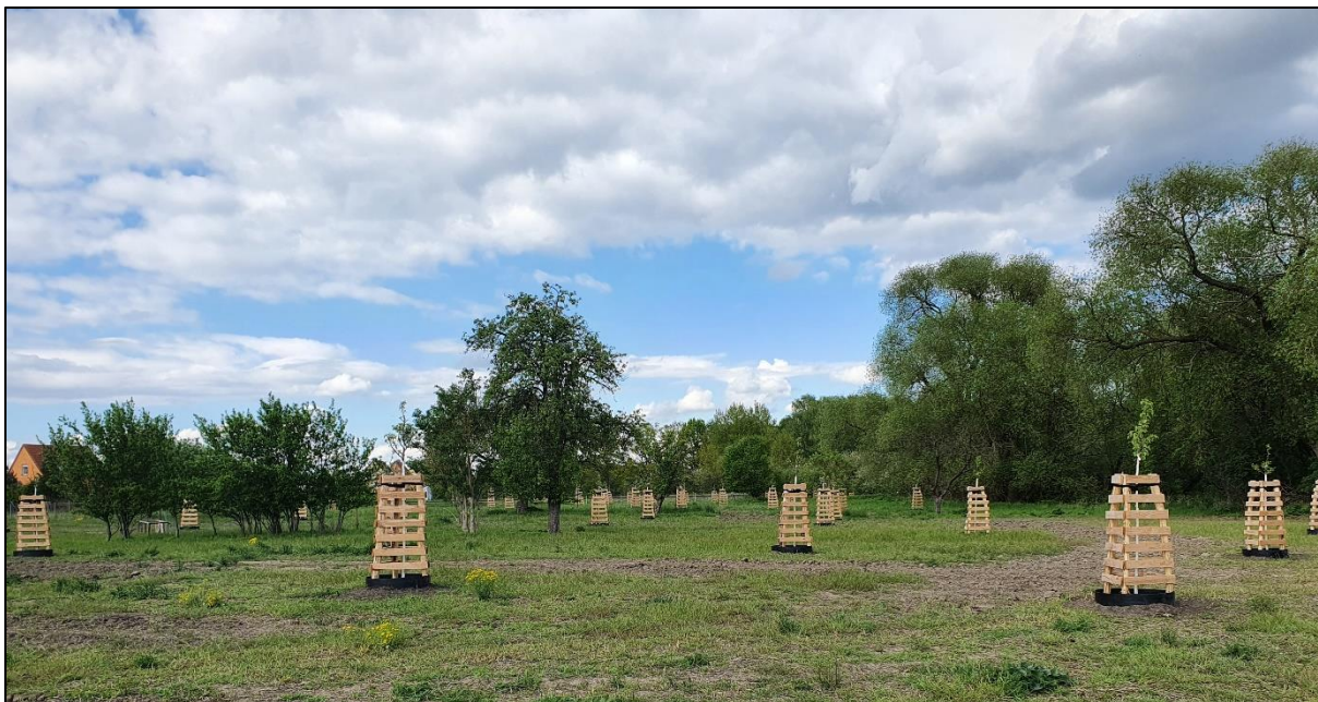
Abb. 1: Streuobstwiese (19.05.2021,)