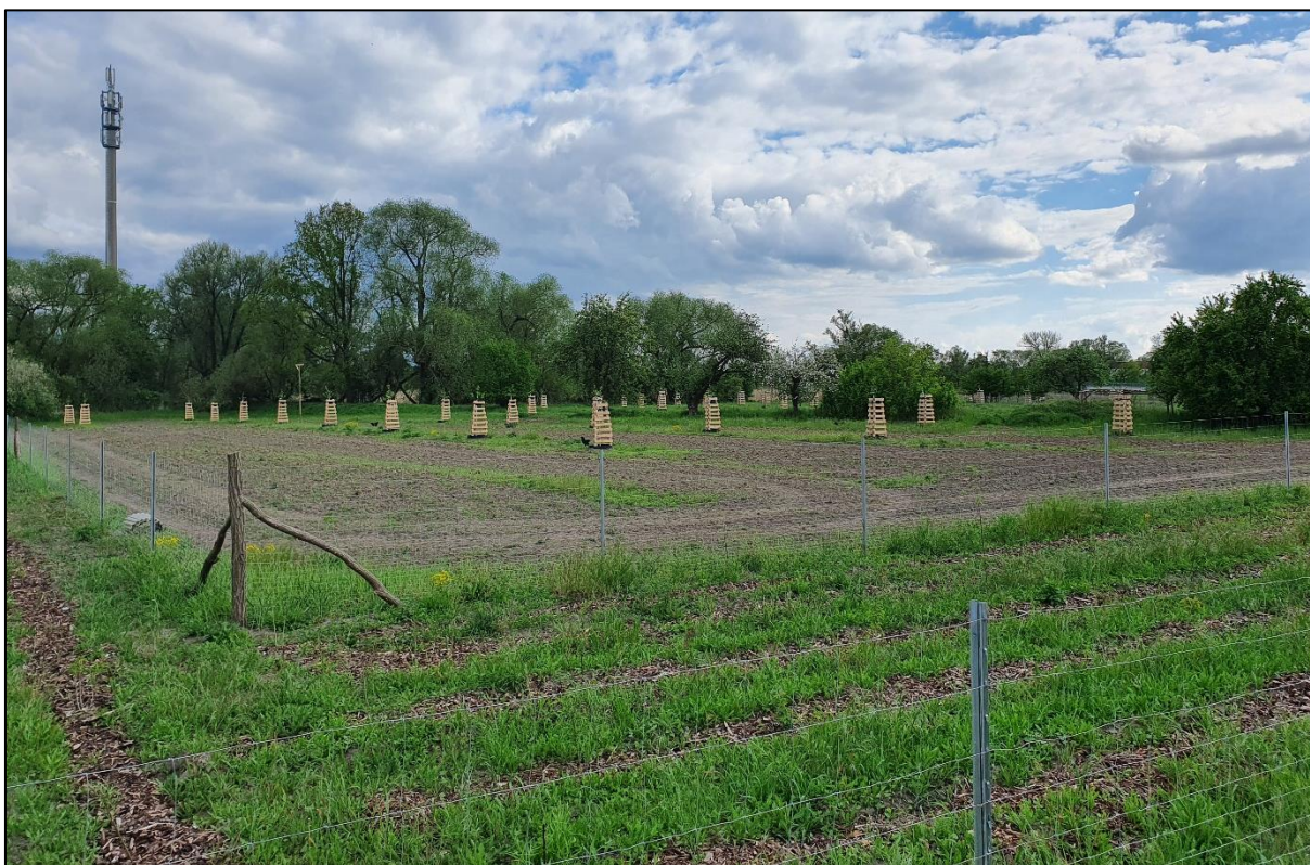
Abb. 2: umgrenzenden Heckenpflanzung Streuobstwiese (19.05.2021,)

Weiterführende Informationen können Sie bei Bedarf unter unten angegebener Adresse erhalten.