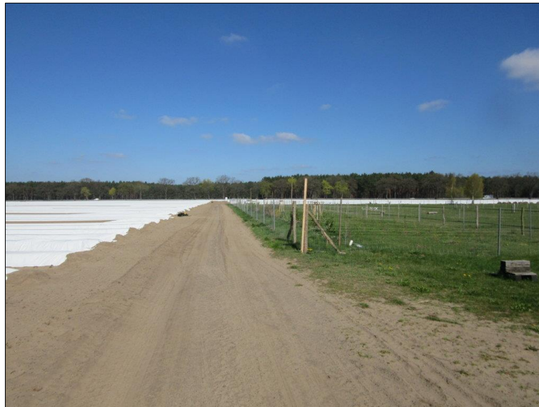
Abb. 1: Unmittelbar nach der Fertigstellung, die Grenzsituation zum Spargelacker ist gut zu erkennen.

Die Hecke wurde im Frühjahr 2016 gepflanzt und in den Folgejahren gepflegt. Wahrscheinlich durch die Nähe zum Spargelacker, der bewässert wird, gab es erhebliche Anwuchs-Schwierigkeiten, so dass in 2017 und 2018 umfangreiche Nachbesserungen und bis in das Jahr 2021 zusätzliche Wässerungen durchgeführt wurden.