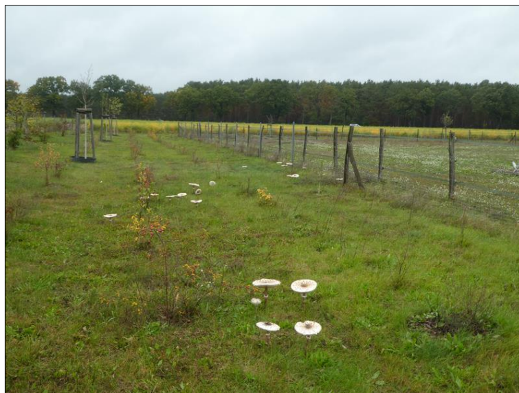
Abb. 2: Zustand im Herbst 2019, Pflanzen sind überwiegend vital, zeigen aber nur sehr langsames Wachstum.

Weiterführende Informationen können Sie bei Bedarf unter unten angegebener Adresse erhalten.