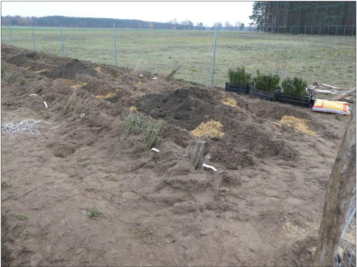
Abb. 1: Vorbereitete Pflanzlöcher und Pflanzen im Einschlag