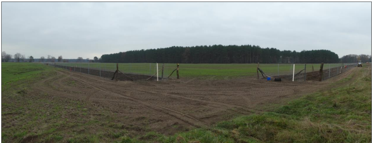
Abb. 2: Pflanzung im Dezember 2020, Panoramaaufnahme