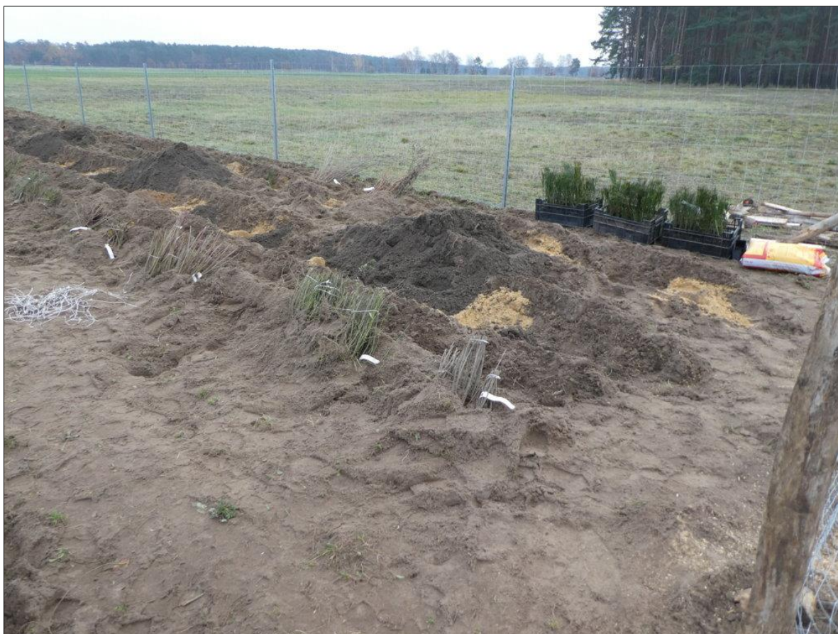
Abb. 1: Vorbereitete Pflanzlöcher und Pflanzen im Einschlag