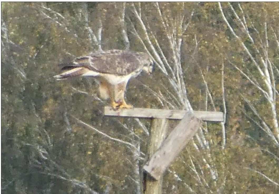
Abb. 4: Mäusebussard auf einer der Greifvogel-Sitzstangen des Heckenprojektes (alle Fotos: Martin Szaramowicz)

Weiterführende Informationen können Sie bei Bedarf unter unten angegebener Adresse erhalten.