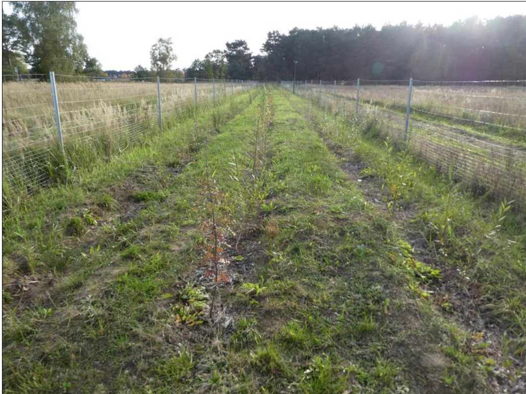
Abb. 3: Gut angewachsene Hecke im Herbst (Oktober 21) nach der Fertigstellungspflege