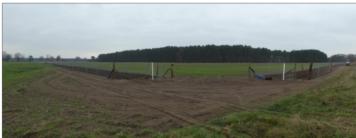
Abb. 2: Pflanzung im Dezember 2020, Panoramaaufnahme