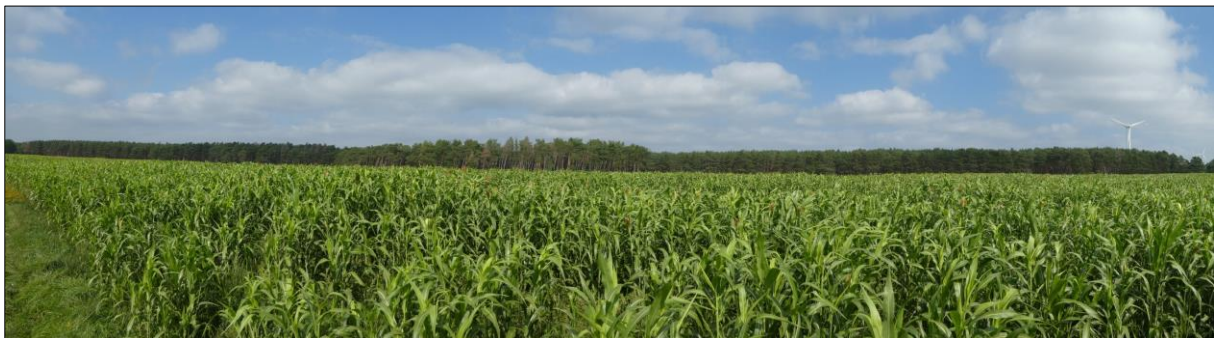
Abb. 1: Ausgangszustand im September 2021

Der Pool wird daher im Intensivacker-Teil durch Regiosaatgut und / oder Selbstbegrünung entwickelt und auf der Kurzzeit-Brache durch direkt einsetzende Pflügenutzung.