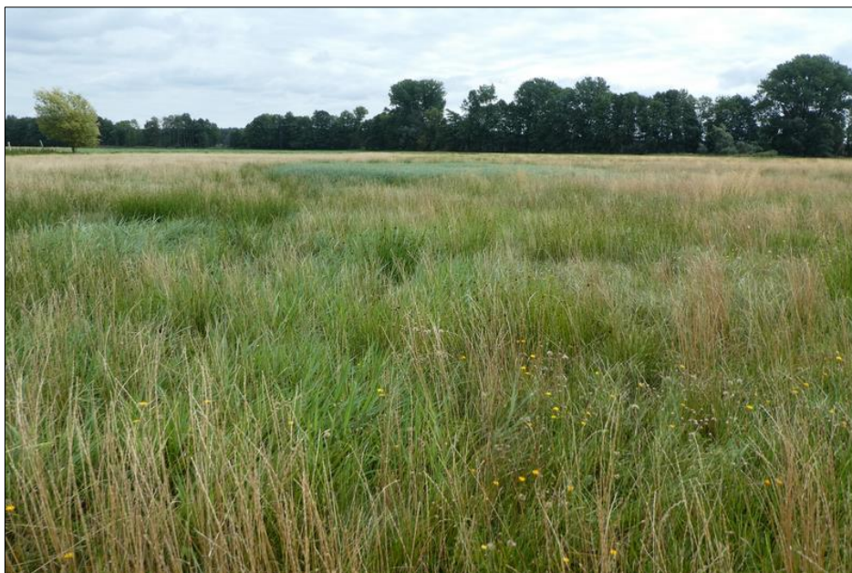
Abb. 2: Blick auf die extensive Grünlandfläche im August 2018

Weiterführende Informationen können Sie bei Bedarf unter unten angegebener Adresse erhalten.