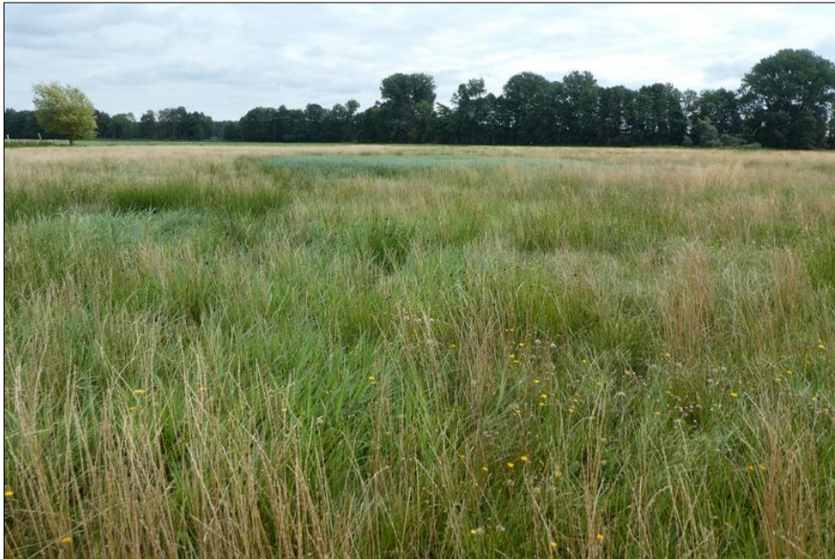
Abb. 2: Blick auf die extensive Grünlandfläche im August 2018

In den Pflegejahren bis 2023 wurden beide Teilflächen durch Mahd entwickelt. Im Jahr 2023 fand auf der Rotationsbrache der erste Teilumbruch statt,´.