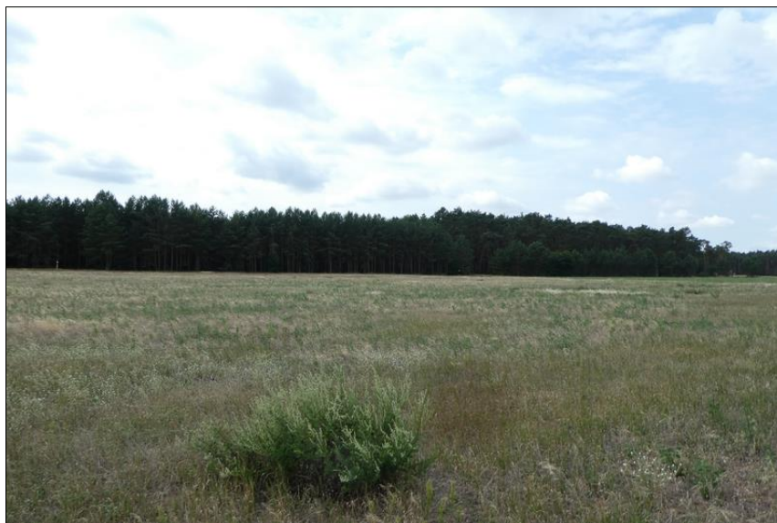
Abb. 1: Blick auf die Rotationsbrache im August 2018

Die Pflegenutzung des Pools hat 2017 begonnen.