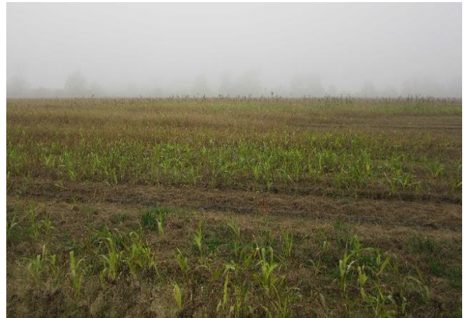
Ackerfläche vor der Ersteinrichtung...