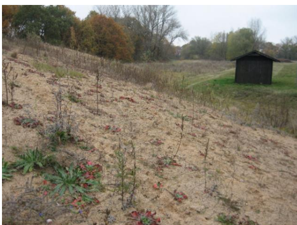
Neu angelegte Trockenstandorte auf Ersatz-Düne