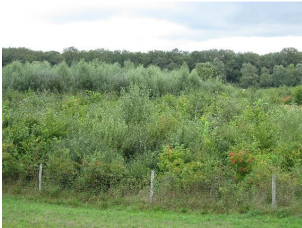
Auwald Geißbreite 2013