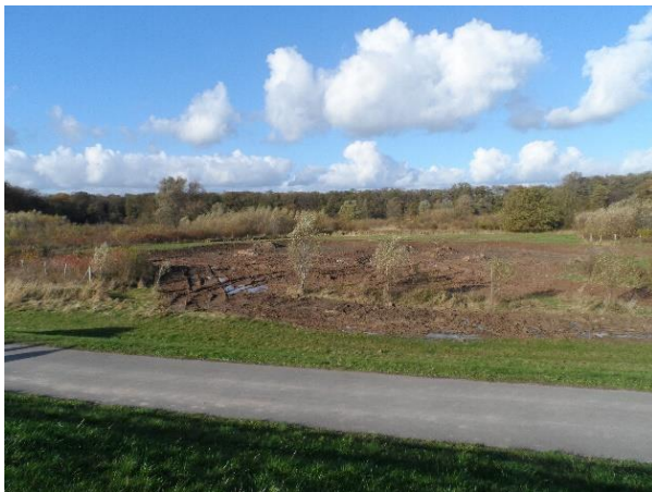
Anlage von Senken durch Bodenreliefierung