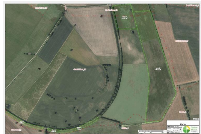
Ca. 24 ha große Maßnahmenfläche am Karthäneknie vor der Umsetzung

Weiterführende Informationen können Sie bei Bedarf unter unten angegebener Adresse erhalten.