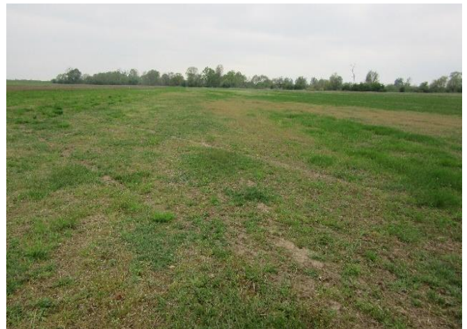
... und im folgenden Frühjahr