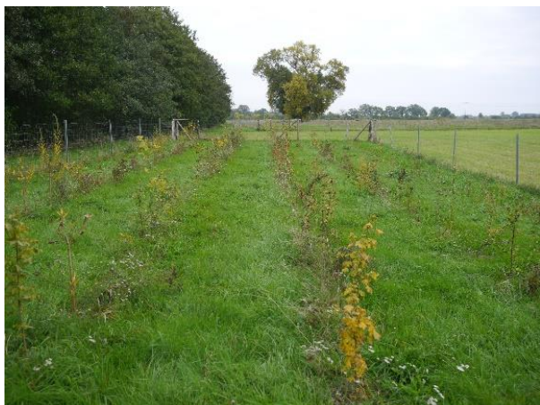
Ufergehölzpflanzungen nach 2 Jahren