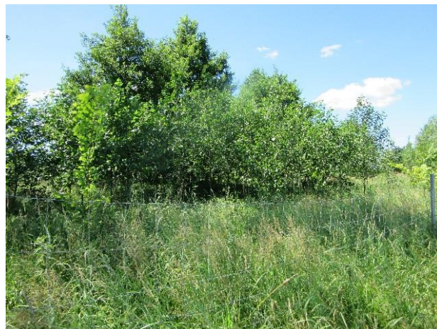
Ufergehölzpflanzung ca. 10 Jahre nach Pflanzung