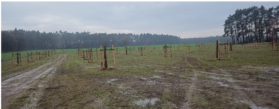
Streesow nach der Pflanzung