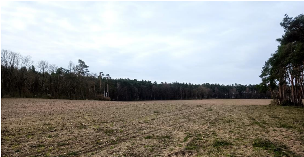
Ausgangszustand in Streesow (Sandacker)