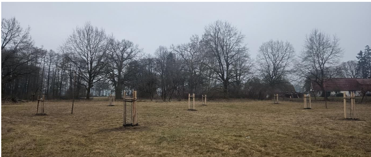
Halenbeck nach der Pflanzung

Weiterführende Informationen können Sie bei Bedarf unter unten angegebener Adresse erhalten.