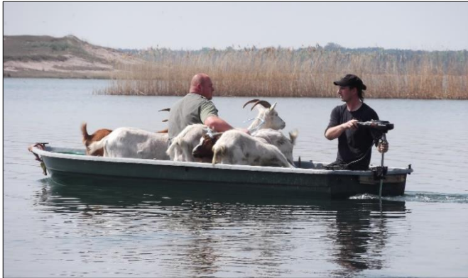
Abb. 1: Überfahrt der Ziegen im April 2014