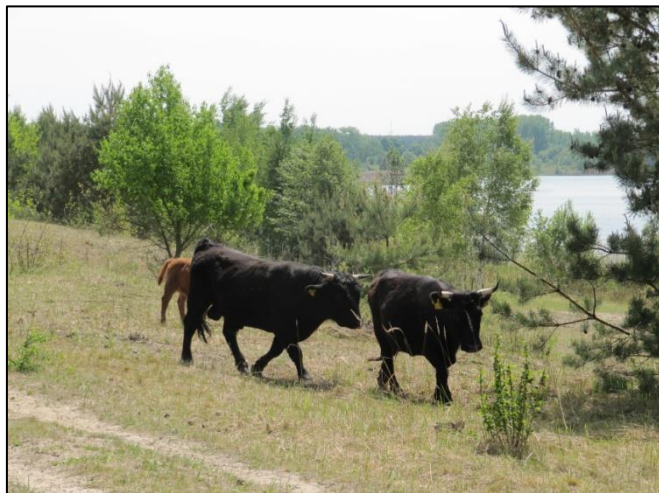
Abb. 3: Rinderbeweidung am Ostufer 2019