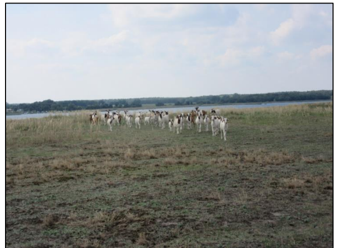
Abb. 4: Ziegenbeweidung auf der großen Insel (Sommer 2022)

Weiterführende Informationen können Sie bei Bedarf unter unten angegebener Adresse erhalten.