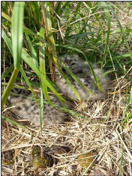
Abb. 1: Nesterzählung und Brutvogelmonitoring, 2024