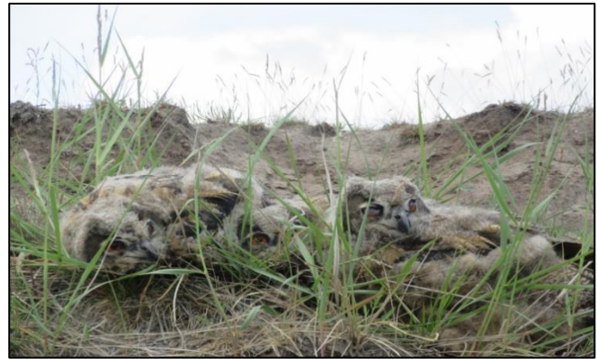
Abb. 2: Uhus auf der großen Insel 2020