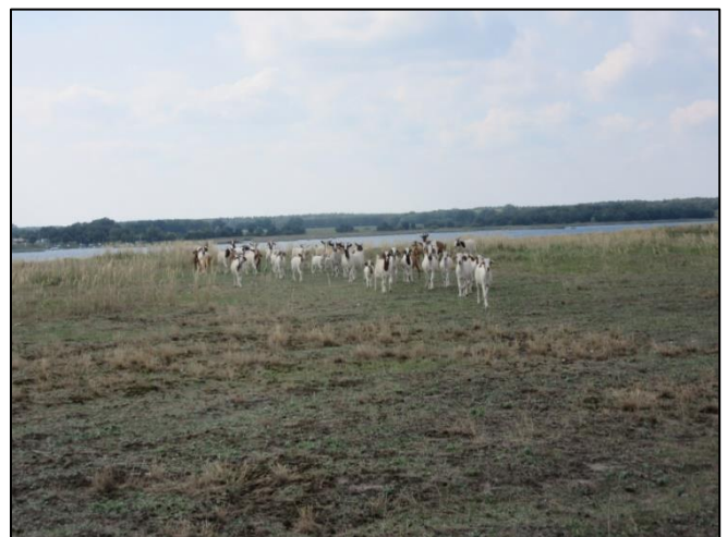
Abb. 4: Ziegenbeweidung auf der großen Insel (Sommer 2022)