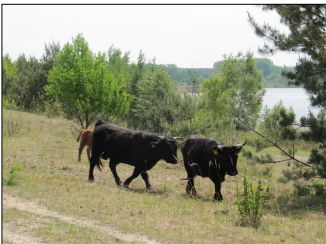
Abb. 3: Rinderbeweidung am Ostufer 2019