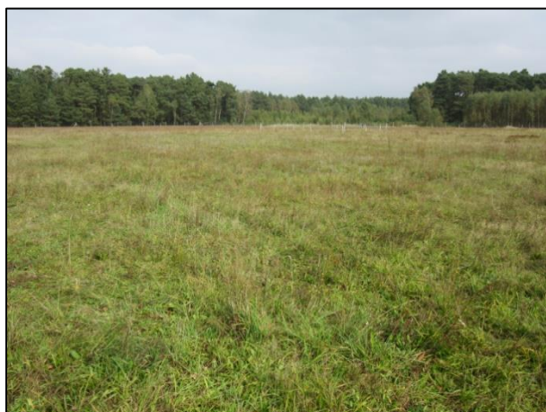
Abb. 2: Umstellung von Ackernutzung zu Extensivgrünland auf 4 ha; Stand Herbst 2017