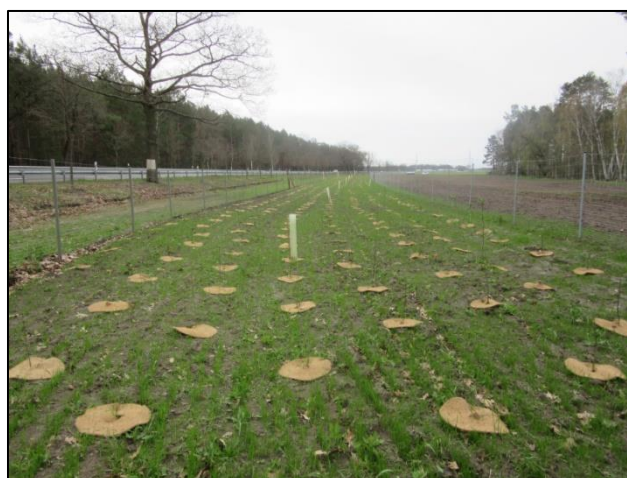
Abb. 4: Fertigstellung der zweiten Hecke im April 2021 (2021,)

Weiterführende Informationen können Sie bei Bedarf unter unten angegebener Adresse erhalten.