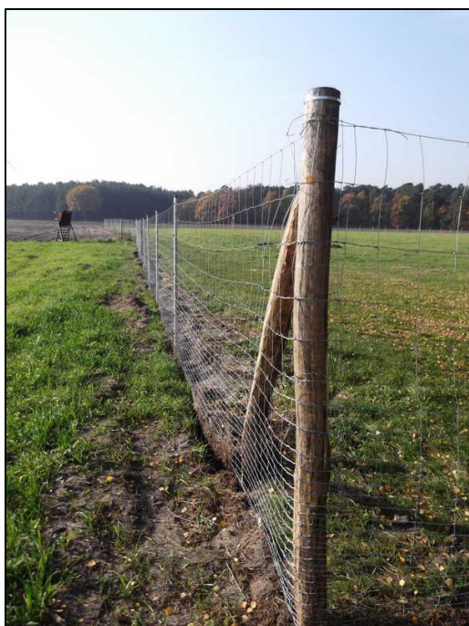
Abb. 3: Die Ersteinrichtung der Weidefläche im Jahr 2015