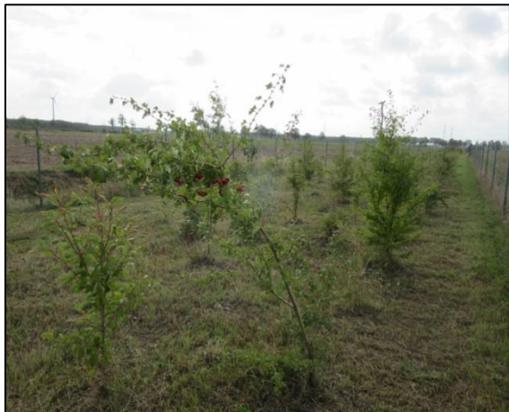
Abb. 1: Artenreiche Hecken gliedern die Agrarlandschaft (Herbst 2019)

Für den Herbst 2020 sind in diesem Maßnahmenbereich weitere artenreiche Windschutzhecken und Feldgehölze geplant. Die Pflanzungen wurden im April 2021 abgeschlossen.