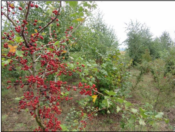
Abb. 1: Artenreiche Hecken gliedern die Agrarlandschaft (Herbst 2020; Foto: Friederike Kunz)

Für den Herbst 2020 sind in diesem Maßnahmenbereich weitere artenreiche Windschutzhecken und Feldgehölze geplant. Die Pflanzungen wurden im April 2021 abgeschlossen. Es folgten im Jahr 2022 Nachpflanzungen von Heckengehölzen.