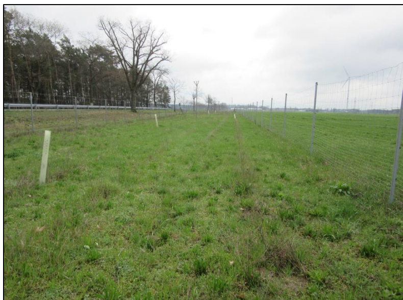
Abb. 4: Zweiter Heckenabschnitt Turnow (2023)