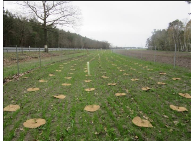
Abb. 2: Fertigstellung der zweiten Hecke im April 2021 (2021,)