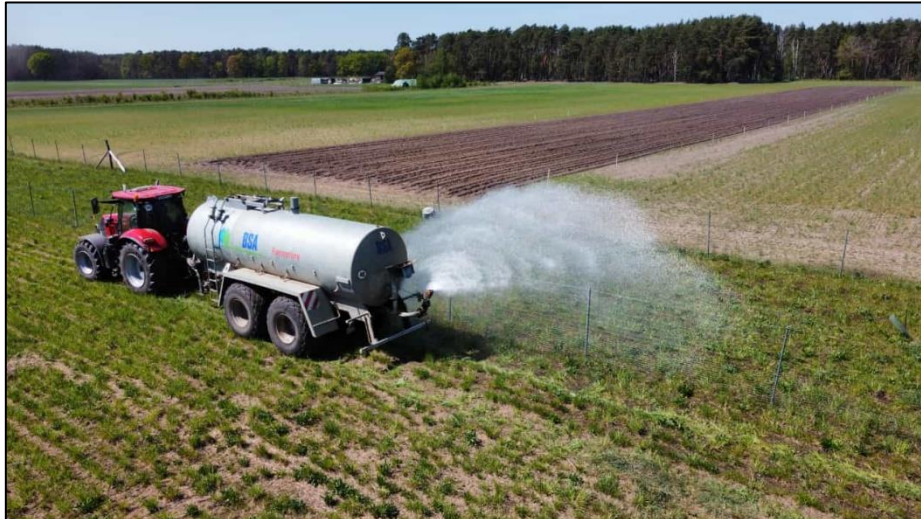
3: Bewässerung der neuangelegten Heckenpflanzungen (Mai 2022)

Weiterführende Informationen können Sie bei Bedarf unter unten angegebener Adresse erhalten.