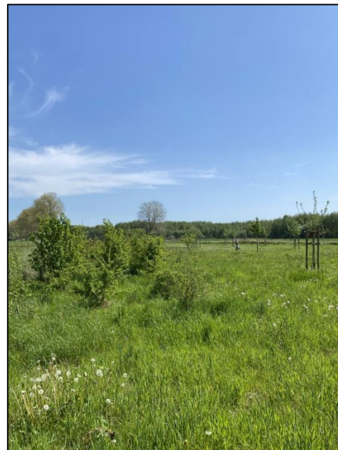
Abb. 3. u. 4.: Maßnahmenentwicklung im Frühjahr 2024

Weiterführende Informationen können Sie bei Bedarf unter unten angegebener Adresse erhalten.