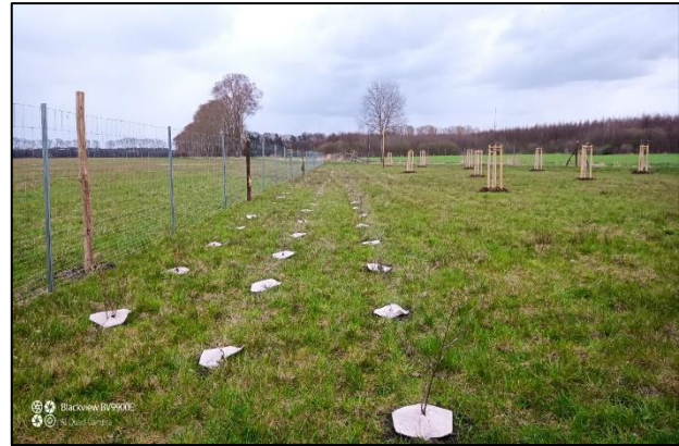
Abb. 1. u. 2.: Maßnahmenumsetzung im Winter 2020