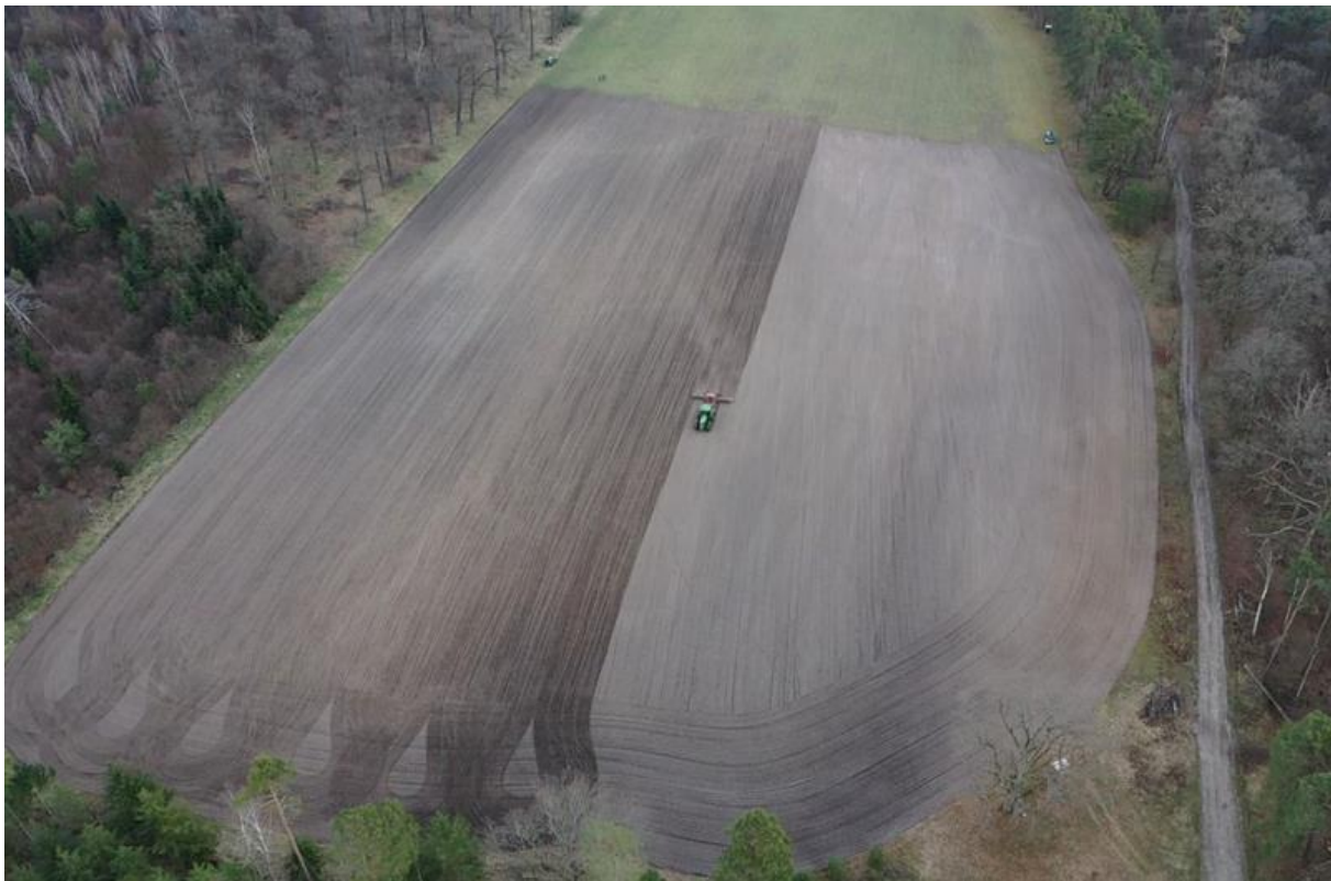
Abb. 2: Aussaat des Regiosaatgutes im April 2021; Beide Fotos: Robert Ettrich

Die Umnutzung der Poolflächen begann 2019 durch Änderung der Nutzung.