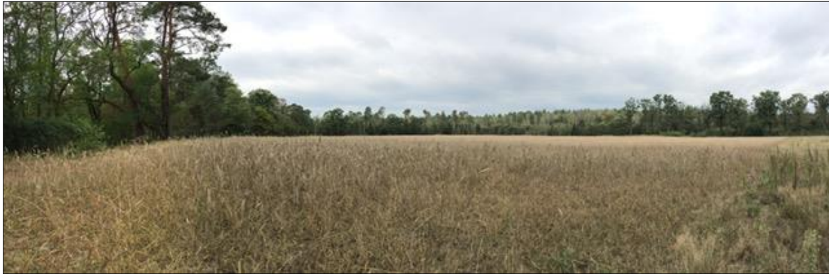
Abb. 1: Ausgangszustand der Maßnahmenfläche

In der Feldflur angrenzend an das Waldgebiet nördlich des Hammerfließ-Gebietes ergibt sich hier die Möglichkeit, angrenzend an den Wald einen neuern Grünlandbereich zu etablieren.