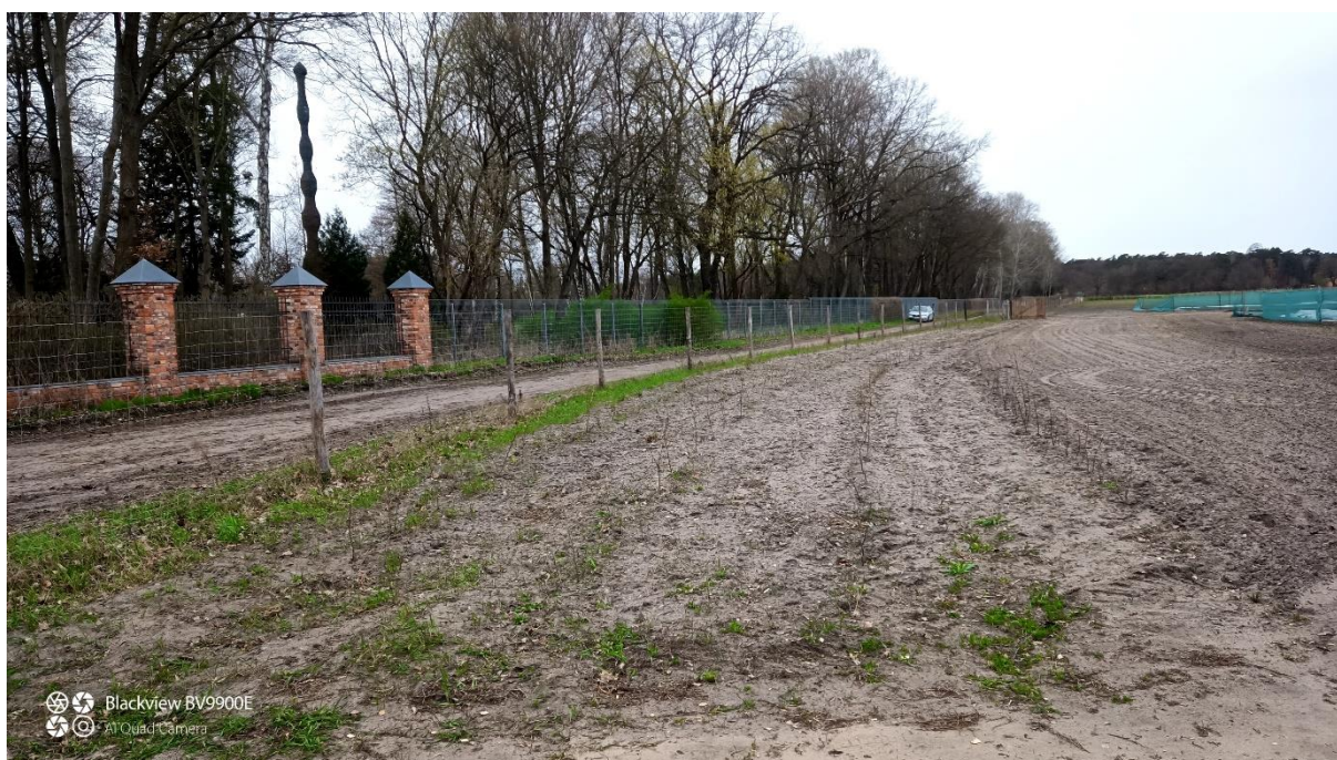
Kurz nach der Pflanzung: Heckenpflanzung mit Pufferstreifen, der mit Regio-Saatgut eingesät wurde

Weiterführende Informationen können Sie bei Bedarf unter unten angegebener Adresse erhalten.