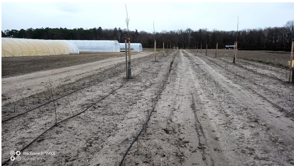
Kurz nach der Pflanzung: Hochstamm-Allee und Heckenstruktur