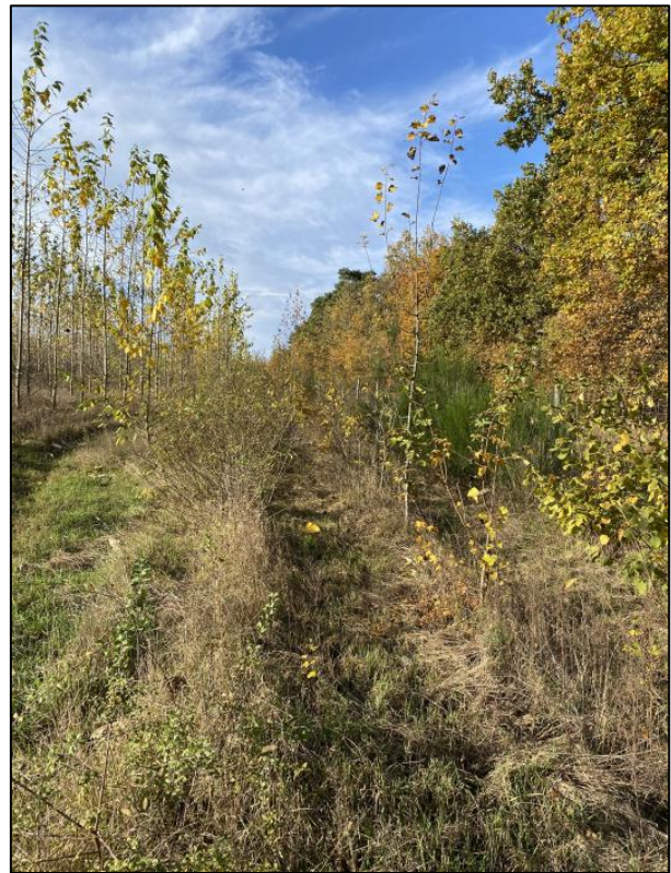
Heckenpflanzung im November 2023

Weiterführende Informationen können Sie bei Bedarf unter unten angegebener Adresse erhalten.