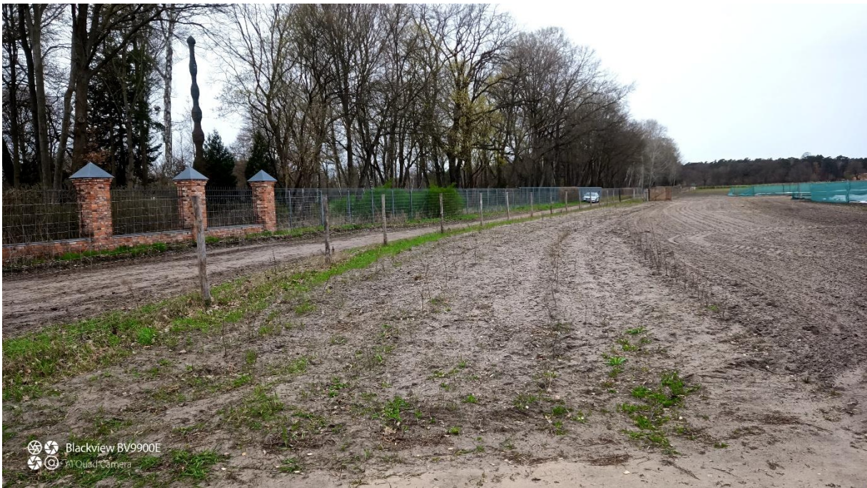
Kurz nach der Pflanzung: Heckenpflanzung mit Pufferstreifen, der mit Regio-Saatgut eingesät wurde