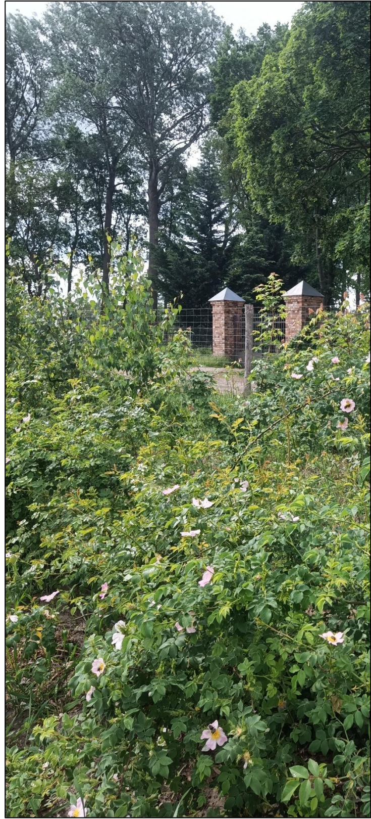
Heckenpflanzung im Mai 2022