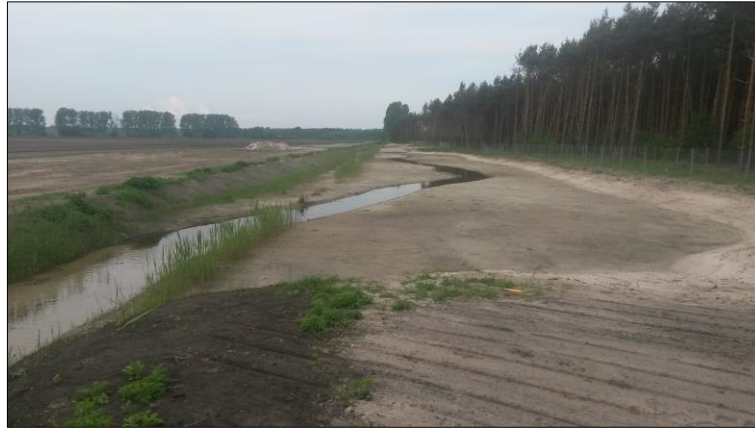
Abb. 1: Rohbodenstadium in der neu geschaffenen Sekundäraue, (Foto: M. Szaramowicz)

Daher wird als zusätzliche, vom eigentlichen Renaturierungs-Projekt unabhängige Maßnahme, die Aufbringung von geeignetem Mahdgut aus einem naturschutzfachlich wertvollen Bereich durchgeführt.