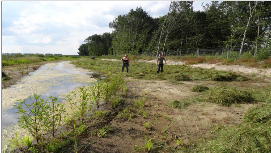
Abb. 2: Ausbringung des Mahdgutes, weitgehend in Handarbeit, (Foto: Büro IDAS, Luckenwalde)

Bei einer Begehung im Sommer 2018 zeigte sich, dass die Vegetationsausprägung in beiden Ersatzauen als artenreich und wertvoll betrachtet werden kann.