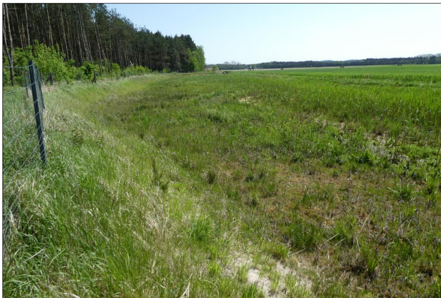
Abb. 3: Blick in einen Sekundärauenbereich im Mai 2018

Bei einer Begehung im Sommer 2018 zeigte sich, dass die Vegetationsausprägung in beiden Ersatzauen als artenreich und wertvoll betrachtet werden kann.