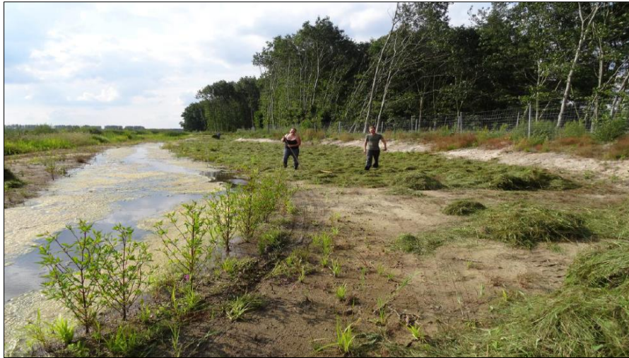
Abb. 2: Ausbringung des Mahdgutes, weitgehend in Handarbeit, (Foto: Büro IDAS, Luckenwalde)

Bei einer Begehung im Sommer 2018 zeigte sich, dass die Vegetationsausprägung in beiden Ersatzauen als artenreich und wertvoll betrachtet werden kann.