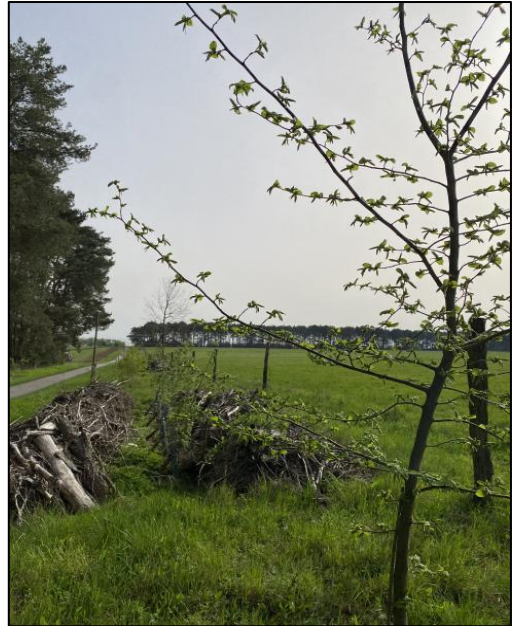
Abb. 2: Blick auf die Habitatstrukturen in südwestliche Richtung (Mai 2022)