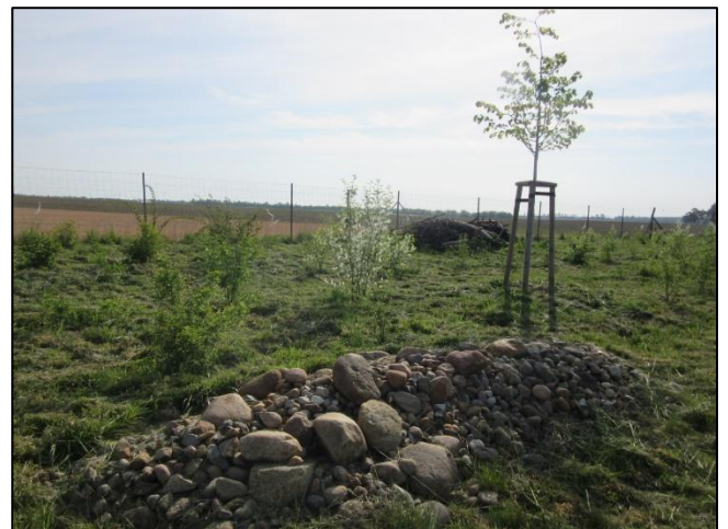
Abb. 4: Heckenstrukturen (Mai 2022)