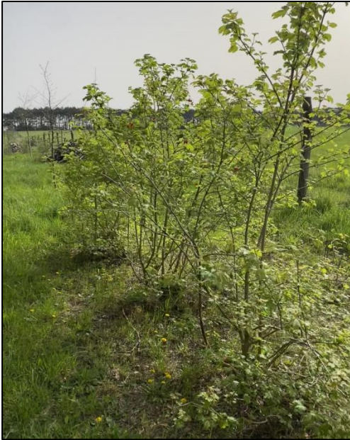
Abb. 1: Anlage Habitatstrukturen (Mai 2024)