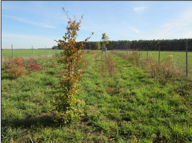
Abb. 6: Blick auf die Habitatstrukturen (Oktober 2022, Foto: Friederike Kunz)