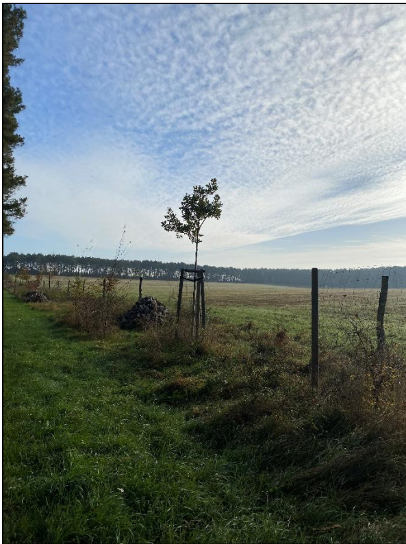
Abb. 7: Blick auf die Habitatstrukturen (Oktober 2024, Foto: Friederike Kunz)

Weiterführende Informationen können Sie bei Bedarf unter unten angegebener Adresse erhalten.