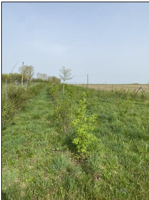
Abb. 3: Heckenstrukturen Mai 2024, Foto: Friederike Kunz)