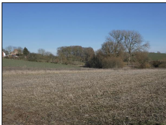
Abb. 3 Ackerschlag in Bertikow vor Maßnahmenumsetzung (März 2021)