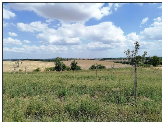
Abb. 2 Streuobstpflanzung in Grünheide im ersten Pflegejahr (August 2022)