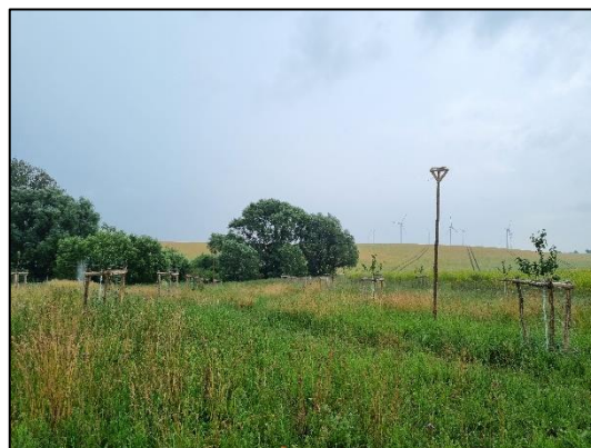
Abb. 4 Streuobstwiese in Bertikow im ersten Pflegejahr (Juli 2022)

Weiterführende Informationen erhalten Sie bei Bedarf unter unten angegebener Adresse.