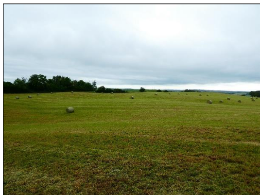
Abb. 1 Ackerschlag in Grünheide vor Maßnahmenumsetzung (Sommer 2020)

Die Gehölzpflanzungen erfolgten im Winter 2021/2022. Es schließt sich eine mehrjährige Fertigstellungs- und Entwicklungspflege bis mindestens Herbst 2024 an.