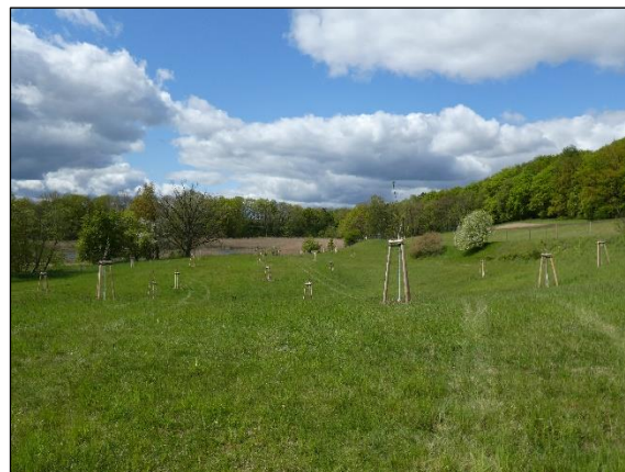
Abb. 4 Streuobstwiese in Parmen in 05/2020. Gepflanzt wurde eine Vielzahl alter regionaltypischer Apfel- und Birnensorten.