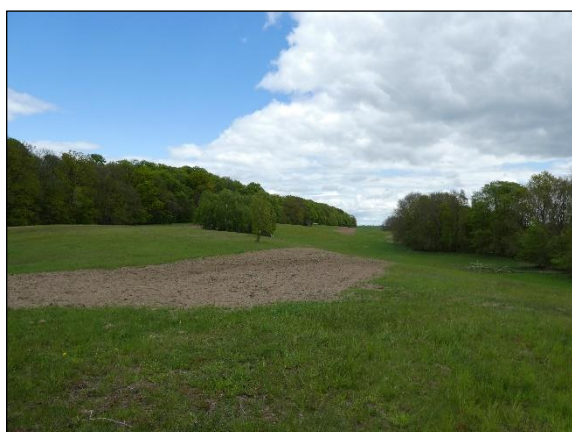
Abb. 4 Extensivgrünland Parmen mit Anfang 2020 eingesäten Blühstreifen in 05/2020.