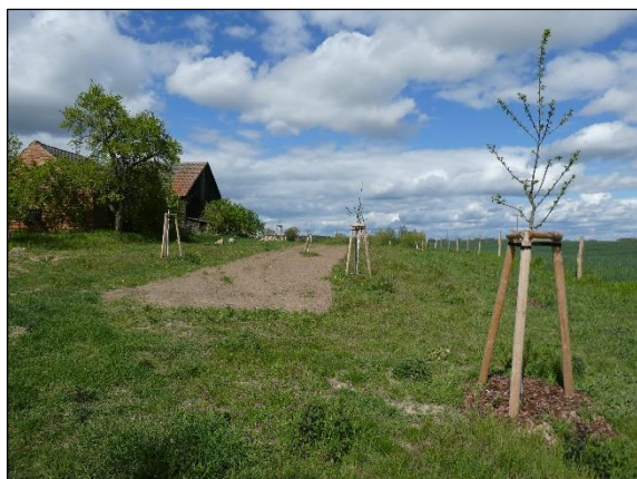
Abb.1 Streuobstwiese 1 in Kraatz in 05/2020. Ergänzende Heckenpflanzung und Blühstreifen.