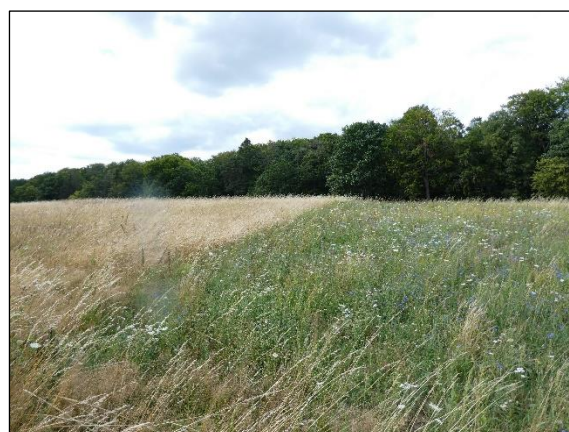
Abb. 5 Extensivgrünland Parmen (li) mit Blühstreifen (re im Bild) in 07/2020.

Weiterführende Informationen erhalten Sie bei Bedarf unter unten angegebener Adresse.