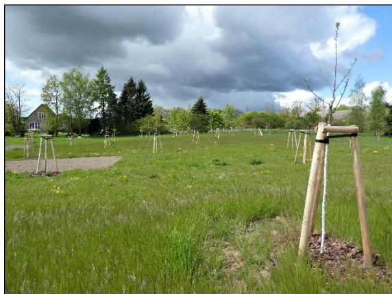
Abb. 3 Streuobstwiese in Christianenhof in 05/2020; Begleitend Heckenpflanzung und (li im Bild) Blühstreifen.