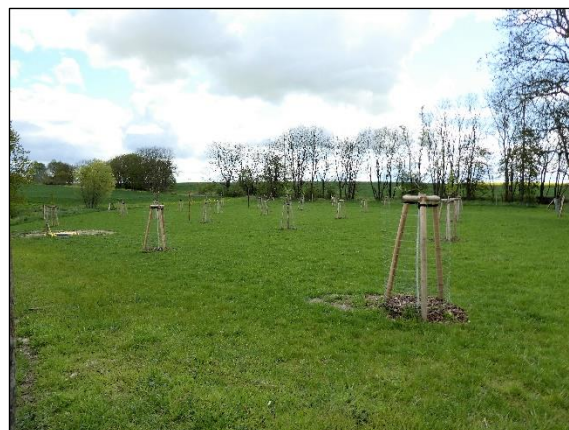
Abb. 2 Streuobstwiese 2 in Kraatz in 05/2020; Grünlandnutzung mit Schafen.