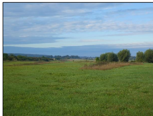
Abb. 2 Frisches Extensivgrünland mit Altgras- streifen; Stand September 2020