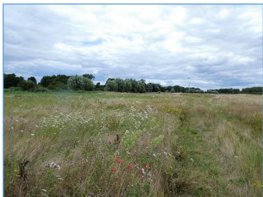
Abb. 1 Frisches Extensivgrünland mit Sommerblüh- aspekt; Stand Juli 2020