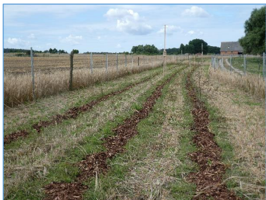
Abb. 3 Heckenfenster; Stand 07/2020

Weiterführende Informationen erhalten Sie bei Bedarf unter unten angegebener Adresse.