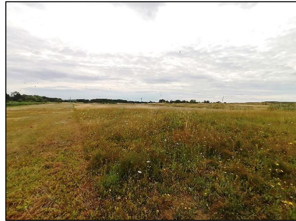
Abb. 2 Frisches Extensivgrünland nach Mahd mit Altgrasstreifen; Stand Juli 2022