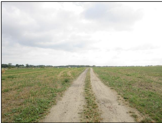
Abb. 3 Weg vor Heckenpflanzung, Stand 08/2028