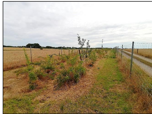
Abb. 4 Wegebegleitendes Heckenfenster; Stand 7/2022

Weiterführende Informationen erhalten Sie bei Bedarf unter unten angegebener Adresse.