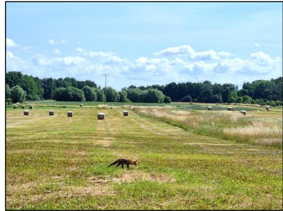
Abb. 2 Frisches Extensivgrünland nach Mahd mit Altgrasstreifen; Stand Juli 2023.