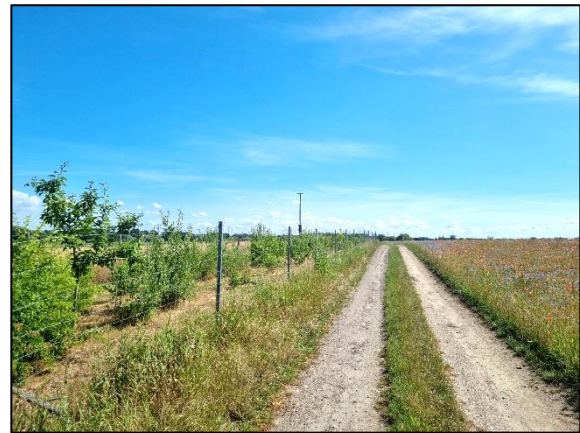
Abb. 4 Wegebegleitendes Heckenfenster; Stand 7/2023.

Weiterführende Informationen erhalten Sie bei Bedarf unter unten angegebener Adresse.