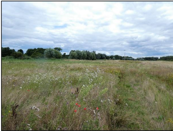
Abb. 1 Frisches Extensivgrünland mit Sommerblüh- aspekt; Stand Juli 2020.