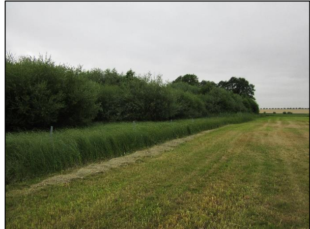
Abb. 4 Grünlandextensivierung nach später Mahd und Pflanzung (Juli 2019)