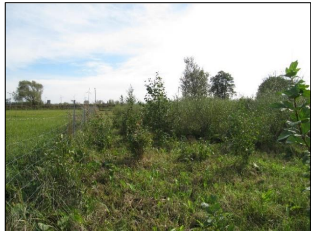
Abb. 2: Pflanzung (September 2014)