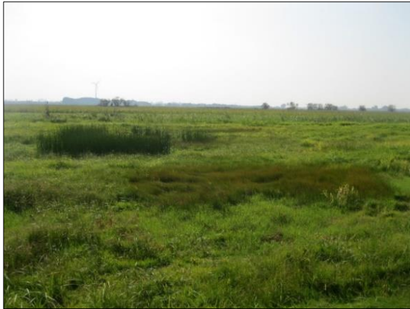
Abb. 3: Grünlandextensivierung (September 2011)