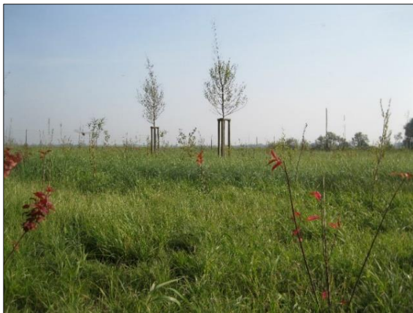
Abb. 1: Pflanzung (September 2011)

Im Herbst 2010 wurden vorbereitende Maßnahmen zur Pflanzung eines Feldgehölzes begonnen. Die Pflanzung wurde im Frühjahr 2011 abgeschlossen, anschließend erfolgte die Pflege bis Herbst 2014. Die Pflanzung wurde erfolgreich durch die Untere Naturschutzbehörde abgenommen.